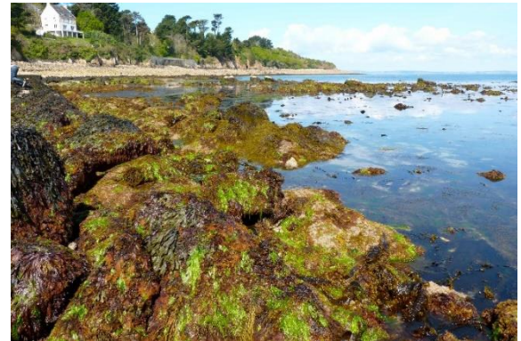
L'estran à marée basse

L'estran peut être de plusieurs natures : sableux, graveleux, ou encore rocheux .